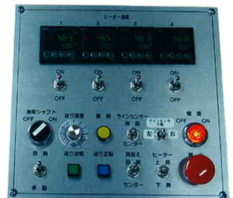
操作パネル Operation Panel

* 巻取り速度は生地・素材によって変わります。 Winding speed will be changed depends on the cloth materials.