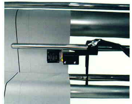
自動耳揃えセンサー Auto. Edge Control Sensor